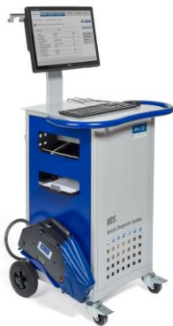
AVL DiTEST Abgas- & Diagnosegeräte

Unser Leistungsspektrum (für weitere Informationen klicken Sie auf ein Bild)