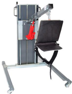
Ergonomie im Karosseriebau